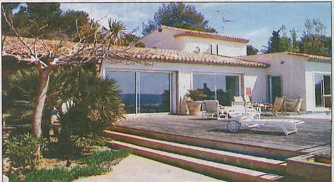
20 MILL: Denne ferieboligen i St. Raphael langs den franske kyststripene Code d'Azur gikk nylig til en norsk kjøper.